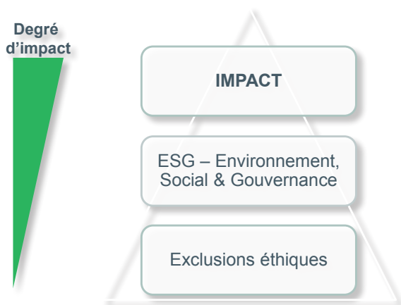
Fig. 1. Échelle de la durabilité

Alors que la construction d'un portefeuille traditionnel tend à optimiser le ratio rendement/risque, la finance durable ajoute une dimension en prenant en compte le rendement social et environnemental de ce portefeuille. Empiriquement, la performance des investissements durables est tout à fait comparable à celle des placements qui ne sont pas gérés sous l'angle de la durabilité.